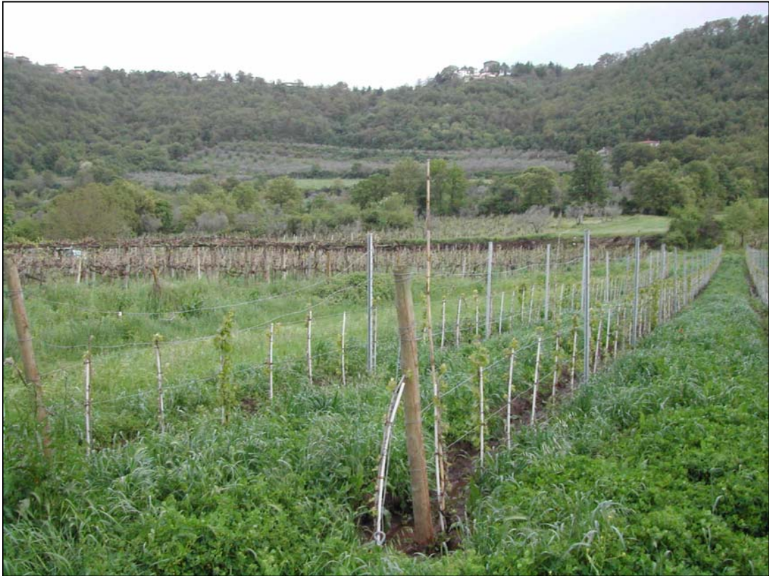
Foto 7. Superfici vitate di apprezzabile rilievo