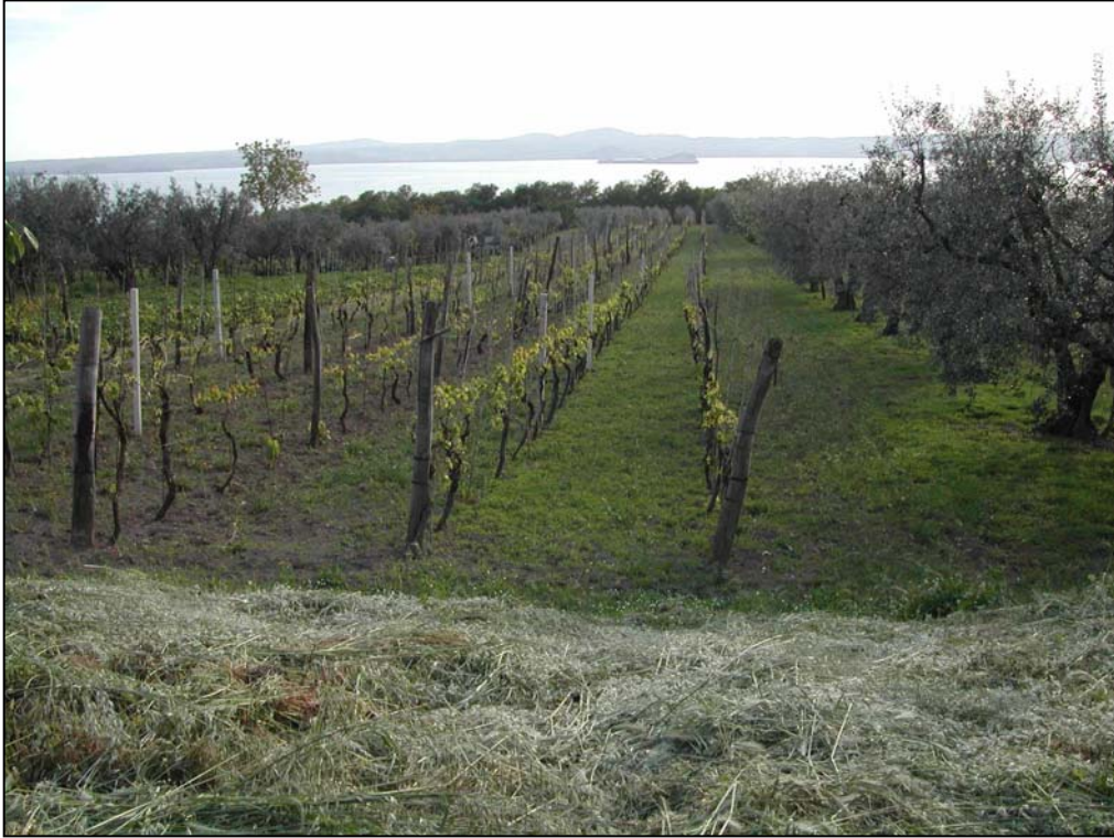
Foto 3. Oliveti, vigneti e piccoli orti famigliari