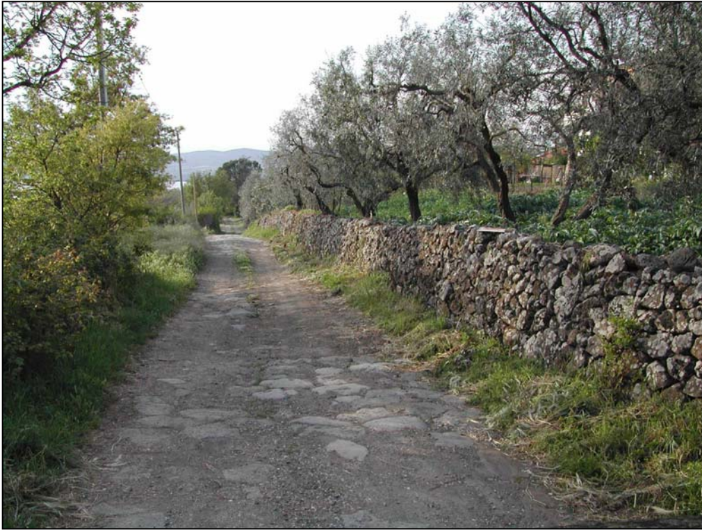
Foto 1 La Medievale Via Francigena, antica strada utilizzata dai pellegrini per arrivare fino a Roma