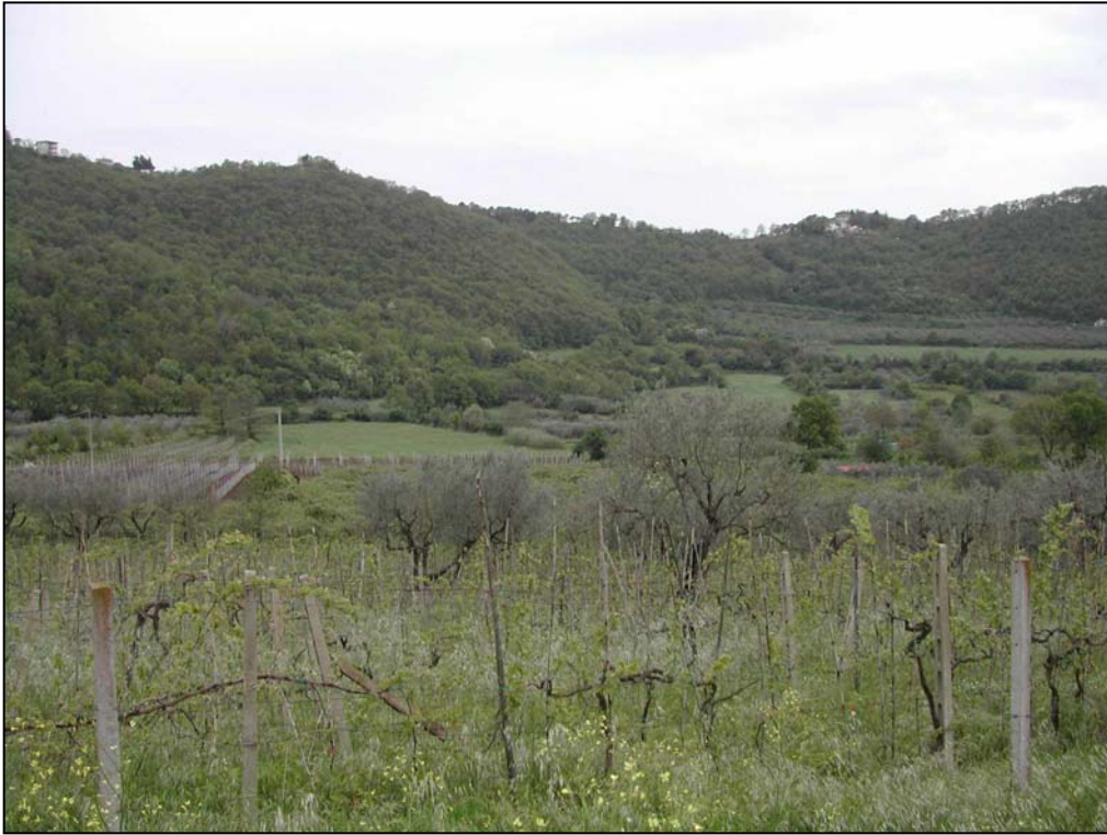
Foto 5. Oliveti, vigneti e orti