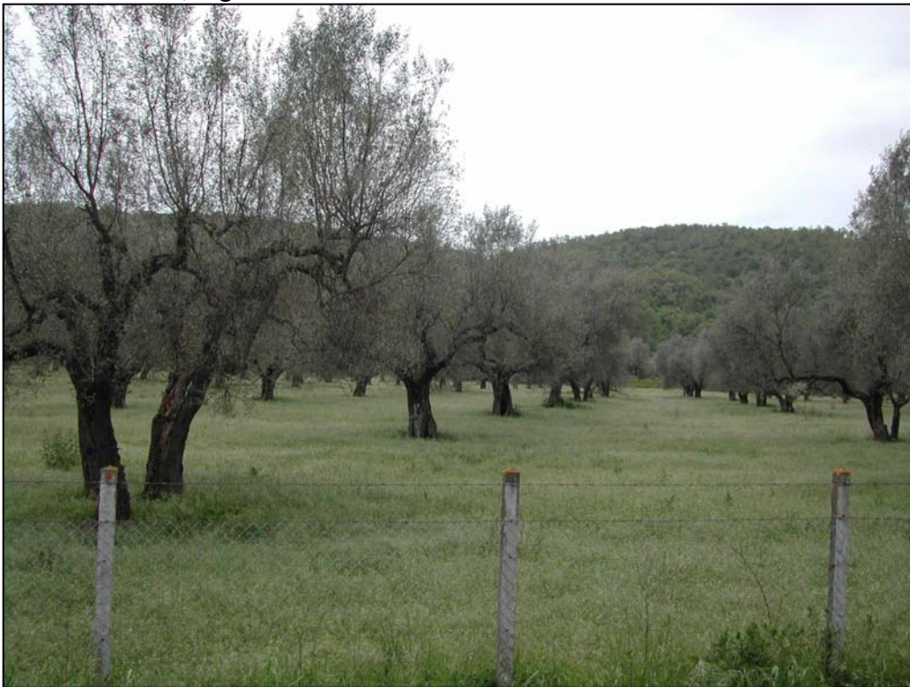
Foto 6. Oliveti, vigneti e orti