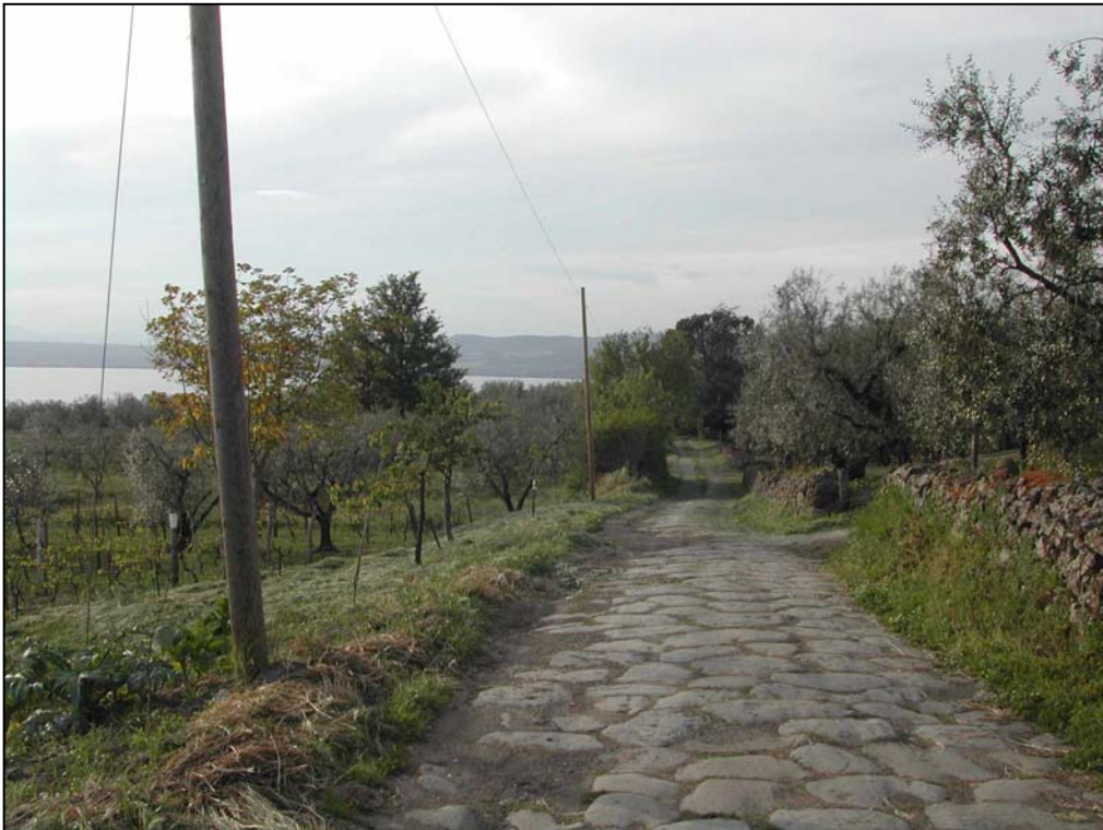
Foto 4. Muretti a secco che costeggiano la via Francigena, col suo basolato (pietre poligonali posate a secco) originale in basalto