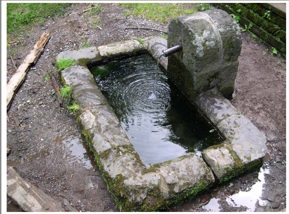
Parco di Turona. Fontanile con all'interno una popolazione riproduttiva di salamandrina dagli occhiali. (maggio 2004)