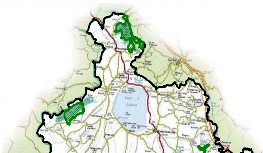
Fig. 2.3.1: Aree protette sul territorio provinciale

Con delibera della Giunta Regionale n. 1100 del 2/09/2002 è stato approvato l'elaborato predisposto dalla Direzione Regionale Ambiente relativo all'adeguamento dello Schema di Piano Regionale dei Parchi e delle Riserve Naturali di cui alla DGR n. 11746/93. In particolare sono state individuate aree di interesse interregionale e regionale (Comprensorio Costiero, del Lago di Bolsena, dei Calanchi, dei Monti Cimini e del Lago di Vico) (Fig.2.3.1).