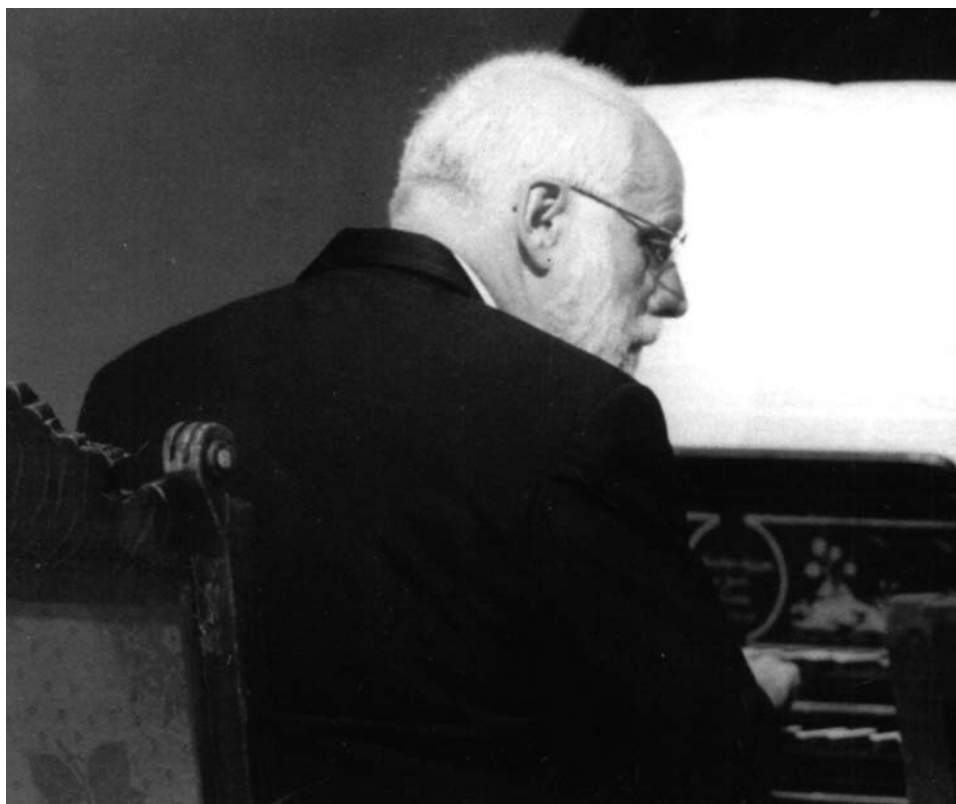
Festival Barocco 2001. Ton Koopman

Dass mein Schatz ist das A und O, Der Anfang und das Ende. Und darum zieh ich dich zu mir. Er wird mich doch zu seinem Preis Aufnehmen in das Paradeis; Des klopf ich in die Hände. Ich komme bald, Amen! Amen! Ich stehe vor der Tür, Komm, du schöne Freudenkrone, bleib nicht lange! Mach auf, mein Aufenthalt! Deiner wart ich mit Verlangen. Dich hab ich je und je geliebet, Und darum zieh ich dich zu mir.