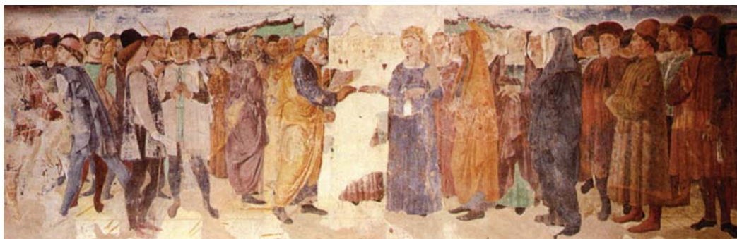
Cappella Mazzatosta. Lo sposalizio della Vergina